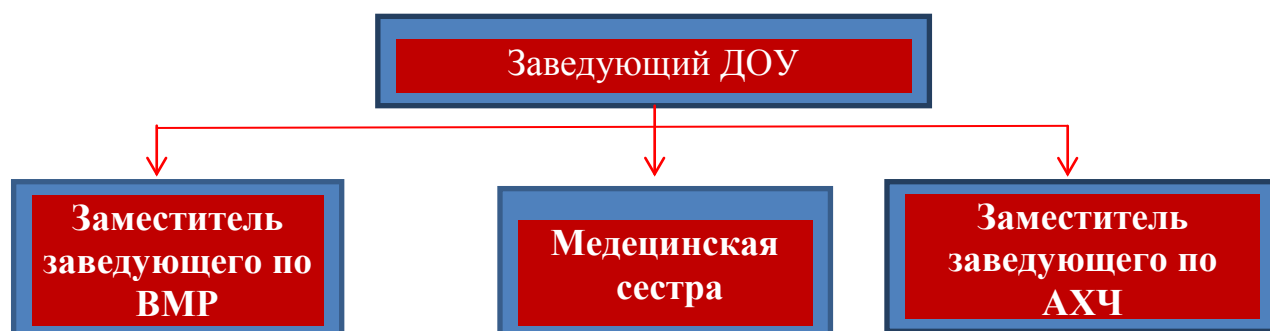
Схема. II направление – административное управление

В состав родительского собрания входят все родители (законные представители) обучающихся, посещающих ДООУ. Полномочия, структура, порядок формирования и порядок деятельности Общего родительского собрания устанавливаются локальным актом ДООУ. Общее родительское собрание действует по плану, входящему в годовой план работы ДООУ. Общее родительское собрание собирается не реже 2 раз в год.